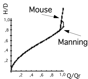
Fig. 4 - Modifica della scala di deflusso utilizzata nel modello MOUSE

A titolo di esempio la figura seguente, la deformazione della scala di deflusso adottata dal modello MOUSE.